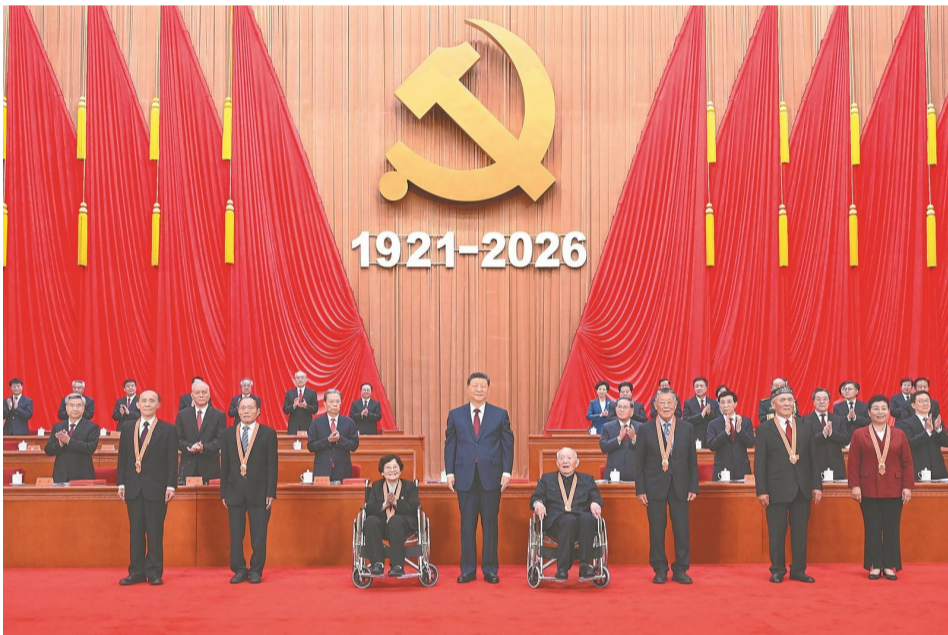
7月1日上午,庆祝中国共产党成立105周年大会在北京人民大会堂隆重举行。中共中央总书记、国家主席、中央军委主席习近平向“七一勋章”获得者颁授勋章。

新华社北京7月1日电 庆祝中国共产党成立105周年大会7月1日上午在北京人民大会堂隆重举行。中共中央总书记、国家主席、中央军委主席习近平向“七一勋章”获得者颁授勋章并发表重要讲话。他强调,105年来,我们党始终坚守为中国人民谋幸福、为中华民族谋复兴的初心使命,在不懈奋斗中创造了彪炳史册的伟大成就。新征程上,全党同志要坚定信心、接续奋斗,不断创造无愧于时代和人民的新业绩。