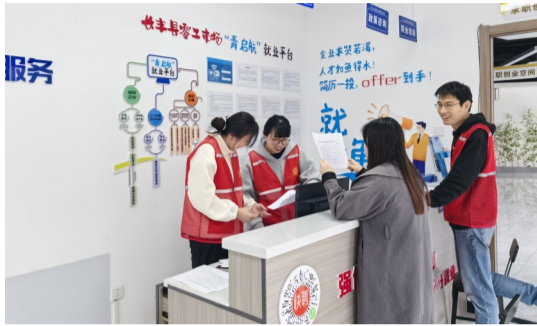
岗集镇综合文化艺术中心。

2025年9月,长丰县零工市场在岗集镇综合文化艺术中心正式启用。这个由县人社局主导运营的公益性平台,总面积120平方米,紧邻“充分就业社区”岗集社区,为零工群体提供求职登记、岗位推荐、政策咨询、技能培训、权益保障等一站式