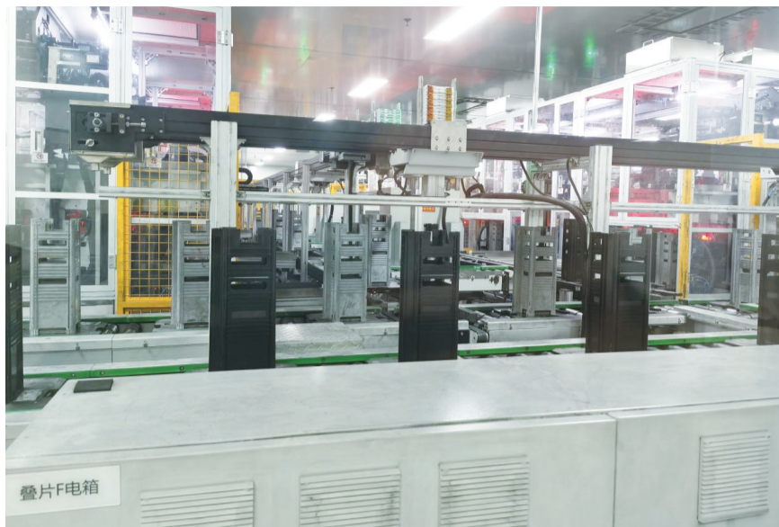
星恒电源(滁州)有限公司锂电池制造车间。

新、创造、创业融合,打造全省数字化建设新标杆。“创新+产业”引“智造”。探索“专家教授+创新平台(团队)+新质企业”。与中科院苏州纳米所、清华大学分别共建苏滁启迪场景式创新中心和中科集萃科创谷;“麦腾科创智慧天地”创新平台已孵化近20家科技型企业;筑医台美好医院共生基地项目投入运营,康先达医疗、瑞艾医疗、戴纳实验科技等21家项目入园即入驻;全省首个民办非营利性明晟人工智能产业研究院将挂牌成立,聚力打造国家级孵化平台。“创新+企业”促“智变”。积极强化科技创新主体地位,促进各类创新要素向企业聚集。累计获批省级专精特新企业38家、省数字化车间10家、省绿色工厂4家、首台套重大技术装备企业13家、高企102家、创新型中小企业61家、市企业技术中心21家。企业研发