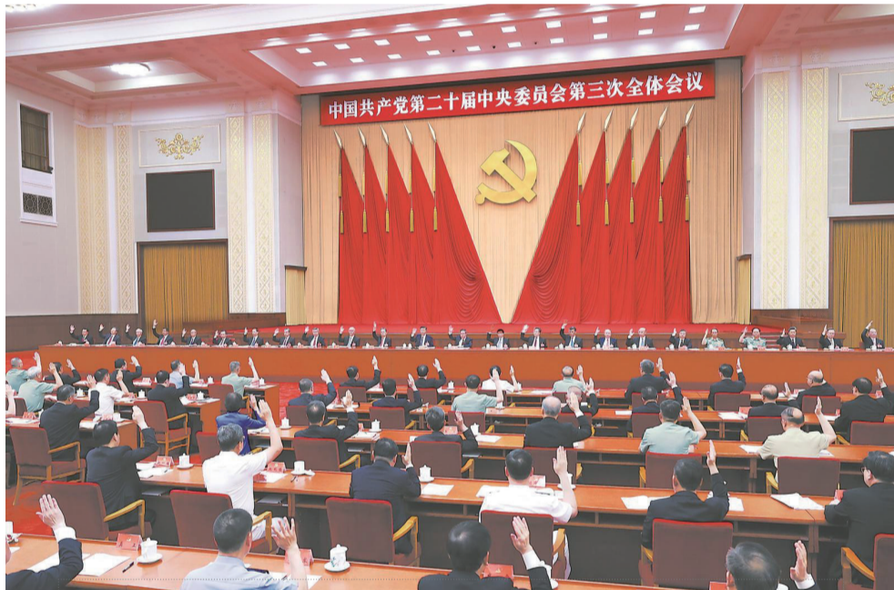
中国共产党第二十届中央委员会第三次全体会议,于2024年7月15日至18日在北京举行。中央政治局主持会议。