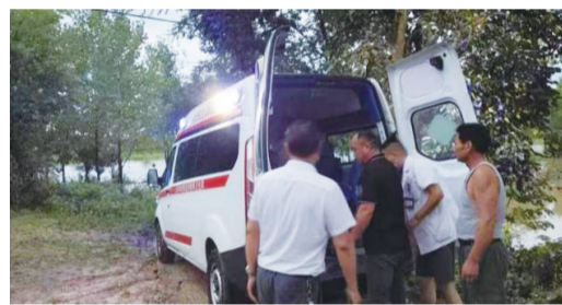
驻村工作队和村两委班子工作人员护送病人前往医院。

由于唐畈村地势较高,前段时间虽受暴雨侵扰,但对村子影响不大,即便如此,驻村工作队和村两委班子党员也依然不忘自身职责使命,一边积极组织村干部及党员支援邻村防汛工作,一边提醒村内群众尤其是老年群体,暴雨即将来临,请大家注意安全,为随时可能到来的极端天气做好准备。12日一早,天空陆陆续续下起雨,雨势渐大,村两委党员及班子成员按照镇防汛指挥部的要求,对全村境内塘堰沟坝、低洼坑处的特殊人群进行排查走访,时刻关注汛情发展情况。很快,到下午五点二十分左右,村旁二道河水位激增,驻村工作队和村两委立刻作出反应,一边将这一情况汇报给镇上,一边积极组织村防汛志愿队做好道路疏通、清淤等工作。