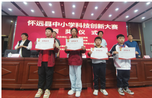
怀远县中小学科技创新大赛颁奖仪式举行。

全民科学素质提升有所突破。 怀远县科协认真履行牵头单位职责,积极推进《蚌埠市全民科学素质提升规划纲要实施方案