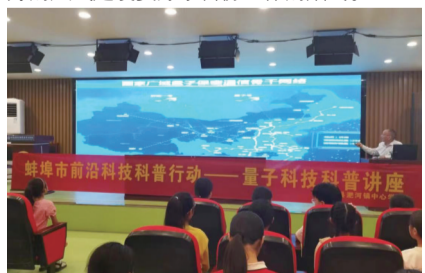
开展蚌埠市前沿科技科普行动——量子科技科普讲座。

强化政治统领,夯实党组织工作基础。 怀远县科学技术协会认真履行科协组织政治责任,始终把学习贯彻习近平新时代中国特色社会主义思想作为首要任务,组织全县科协系统和广大科技工作者认真学习宣传贯彻党的二十大精神,深入学习贯彻习近平总书记考察安徽重要讲话精神,结合主题教育,为全县科普工作提供了强有力的思想保证。县科协始终把政治建设摆在首位,坚决贯彻落实中央八项规定,转变工作作风,落实“一岗双责”制度,全面推进从严治协,认真落实“一把手”末位表态,严格“三重一大”事项按照规范运行,狠抓“六风”思想教育整顿工作,把良好的风气建设贯穿于科协工作的始终。