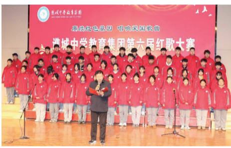
潍城中学教育集团举行第六届红歌大赛。

到深加工进行转变,让生姜“就地加工”“就地升值”。二是发展冷链仓储、物流配送等现代服务业,争取将虎头姜交易市场建设为阜阳地区乃至皖北地区重要的生姜交易集散地,逐步建立起产销一体化经营、一二三产业融合发展的全产业链发展体系,将增值收益和就业岗位尽量留在本地、留给农民,实现农业增效、农民增收、农村繁荣。