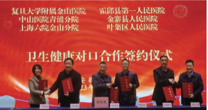
上海复旦大学附属金山医院与霍邱县第一人民医院正式建立对口合作关系。

下一步,临泉县高塘镇将立足生姜特色产业,一是加大招商引资力度,由传统种植到初加工再