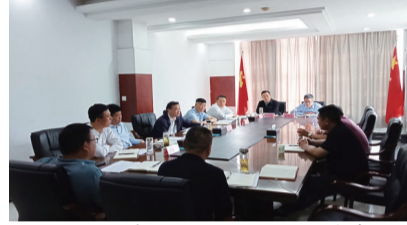
颍上县委书记张银军到迪沟镇带案下访约谈,县直有关单位负责人参加接待。

强化班子建设,筑牢乡村振兴“桥头堡”。该镇把抓实基层党组织建设和队伍建设作为引领乡村振兴的突破口和关键点,抓学