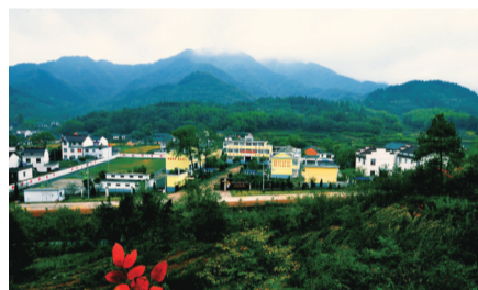
群山环抱，绿意盎然的美丽校园。

在享有“温泉古镇、名茶之乡”美誉的庐江县汤池镇，有一所颜值与实力并存的学校。这就是秉持“创山区农村特色学校”办学目标，践行“依法治校、安全立校、环境美校、名师强校、质量兴校”办学思路不断前行的庐江县汤池镇果树学校。