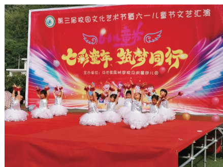
校园文化艺术节暨六一儿童节文艺汇演。

“用理想之光点燃每一个孩子的梦想，用爱心呵护每一个孩子的成长，用责任担当守护每一个家庭的希望”，带着这份执着的追求，果树学校人初心不改，步履不停，他们用青春与激情、辛劳与智慧，编织了一幅“喜看稻菽千重浪，倾听幼竹拔节声”的丰收场景。(李好)