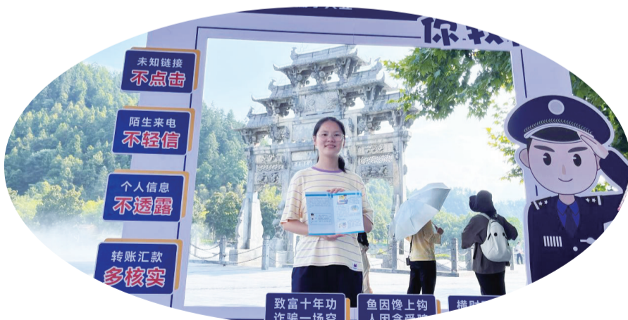
西递镇组织开展反诈知识科普宣传打卡拍乐活动。

西递镇卫生院院长,西递镇中心小学校长,西递镇林业站、西递镇农技站长等“三长”工作初有成效,该镇支持引导以“三长”为代表