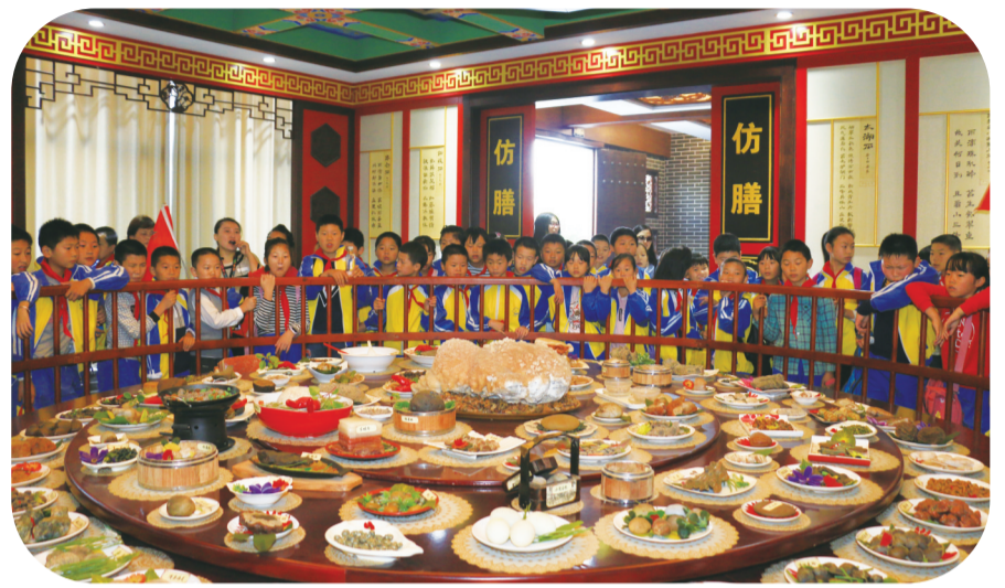
学生参观徽州奇石馆,观看“满汉全席”石头宴,学习关于石头的科普知识。

普阵地作用,开展形式多样的科普活动,丰富多彩的展览展示、精彩纷呈的科普讲座、与学校合作共建……对向青少年普及科普知识起到了重要的作用,使文博园真正成为休闲、学习、艺术欣赏的好地方。文博园定期开展科普讲座,由专业手工艺大师对青少年进行陶瓷、烙画、国画等传统技艺的理论知识教学,向青少年宣讲手工技艺的基本要领,并指导他们现场参与制作。同时积极参加科技、文化、卫生“三下乡”活动,在科技活动周、全国科普日配合省市相关部门开展科技咨询、科技实践等