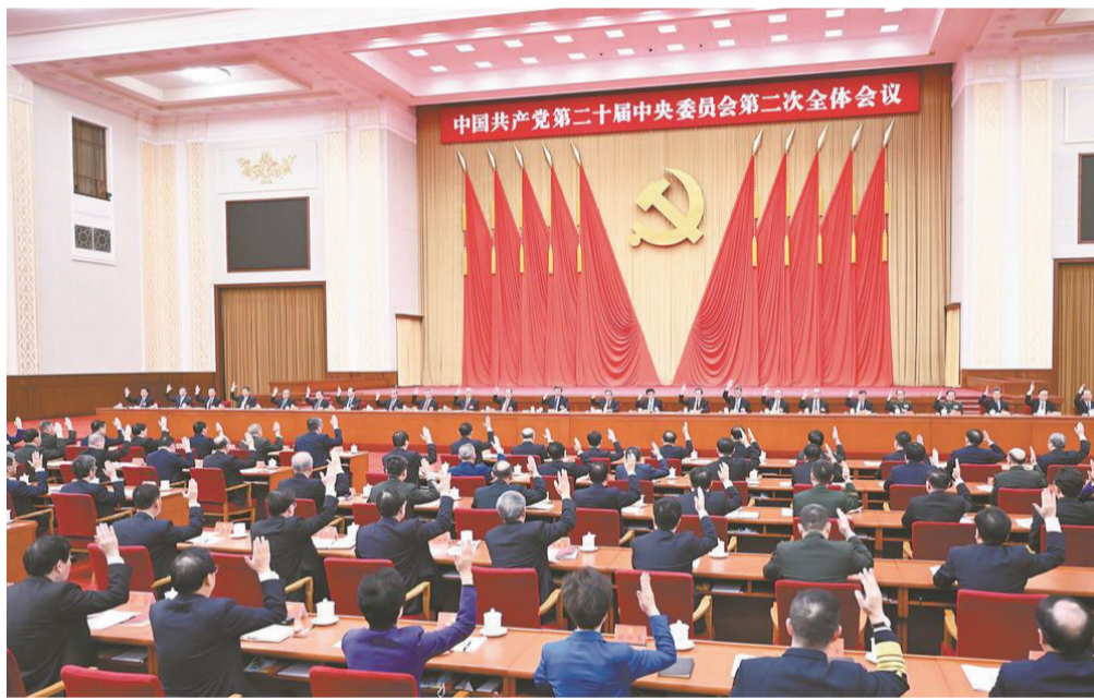
中国共产党第二十届中央委员会第二次全体会议,于2023年2月26日至28日在北京举行。中央政治局主持会议。