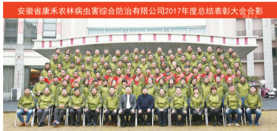
公司总结表彰大会。