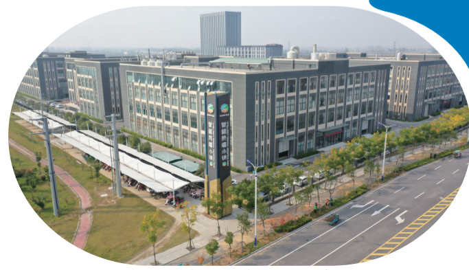
宿马现代产业园区智能终端小镇。