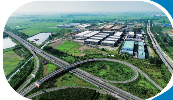
灵璧县轴承产业园。