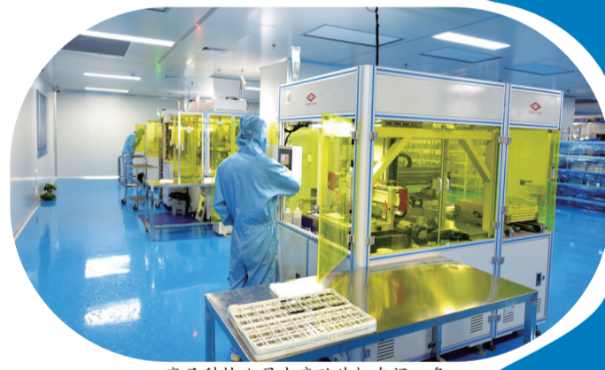
赢圣科技公司生产贴片机车间一角。