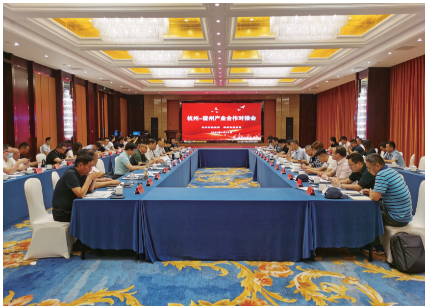
杭州-宿州产业合作对接会。