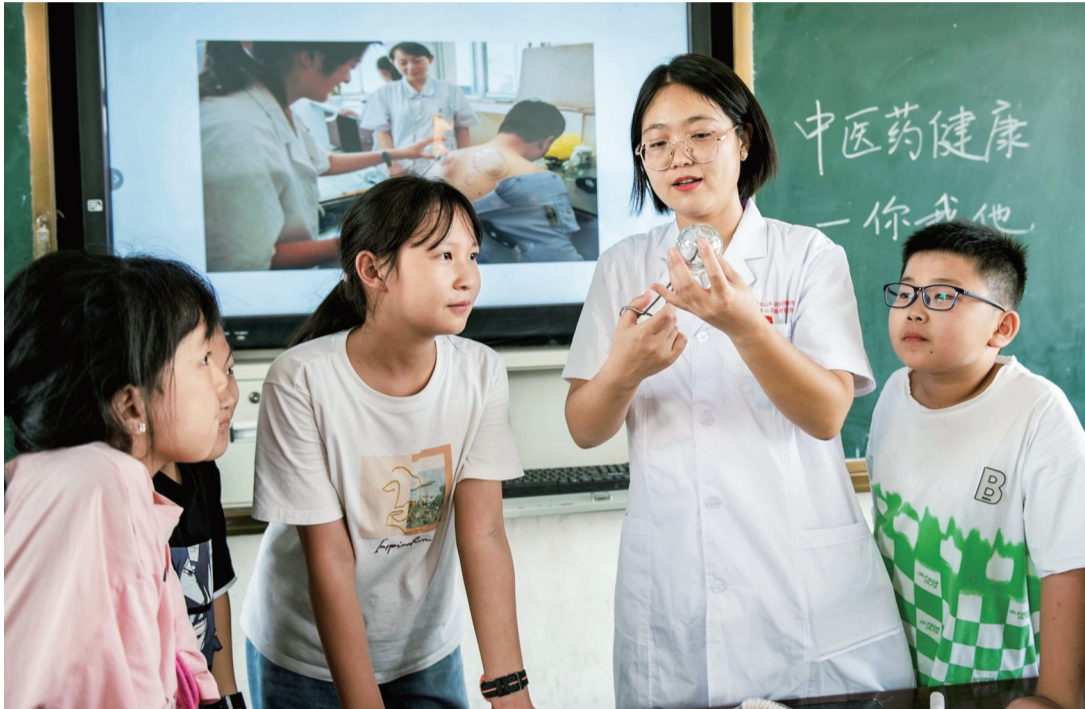
9月8日,含山县铜闸镇卫生院开展“中医药文化进校园”活动,该院中医医师来到铜闸镇庆广小学,通过图片、视频、实物,向学生传播中医药知识,让他们感受到中医药文化的魅力。